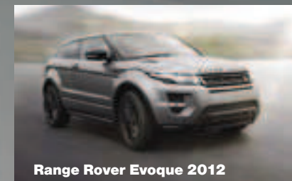
Range Rover Evoque 2012