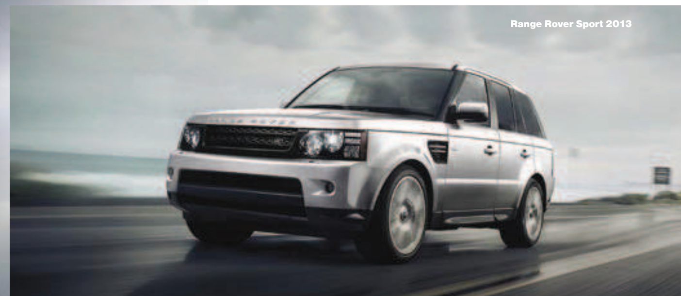
Range Rover Sport 2013

Range Rover nepůsobí tak futuristicky jako RR Evoque, zachovává si majestátní linie a konzervativní ikonický vzhled. Vše je jednodušší, elegantnější a modernější. Základní aspekt středového panelu v podobě jeho ohraničení svíslými lištami, jež jsou částečně skryty, zůstává zachován. Celek vozidla je však hranatější a řada detailů získala v reakci na nové trendy designu reprezentované prostřednictvím verze Range Rover Evoque. Základní členitost přístrojové desky se příliš nemění, a to ani přes pozměněné uskupení jednotlivých prvků.