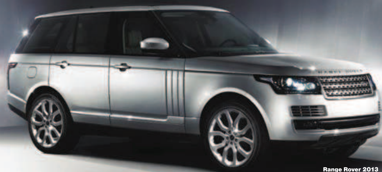
Range Rover 2013

Range Rover byl a stále je úplně prvním všestranným luxusním vozidlem 4x4 a lze ho tak považovat za milník ve vývoji vozidel segmentu SUV (Sport Utility Vehicle). Seznámení se značkou Range Rover jsme pro Vás v minulosti již otiskli u příležitosti 40. výročí vzniku značky Range Rover. Značka se může pochlubit jedinečnou historií inovací svých produktů, avšak Range Rover pravděpodobně zůstane historicky nejvýznamnějším vozidlem. Je to zároveň jedno z nejdůležitějších vozidel v celé historii motorismu. Range Rover byl a je úplně prvním vozidlem na světě, které bylo stejně výkonné na silnicích i v terénu. Stal se tak jedním z nejvýznamnějších vozidel v celé historii motorismu. Historie značky se začala psát v roce 1970.